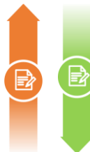
АДМИНИСТРАЦИИ МУНИЦИПАЛЬНЫХ ОБРАЗОВАНИЙ ТУЛЬСКОЙ ОБЛАСТИ