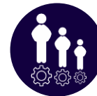
РЕСУРСО- СНАБЖАЮЩИЕ ОРГАНИЗАЦИИ