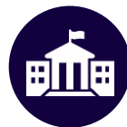
ОРГАНЫ ИСПОЛНИТЕЛЬНОЙ ВЛАСТИ ПРАВИТЕЛЬСТВА ТУЛЬСКОЙ ОБЛАСТИ