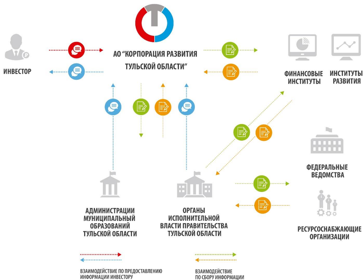
Схема взаимодействия с инвестором в рамках работы по сопровождению инвестиционных проектов.