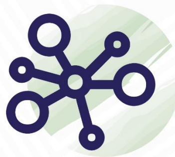
СОФИНАНСИРОВАНИЕ СТРОИТЕЛЬСТВА ИНФРАСТРУКТУРЫ