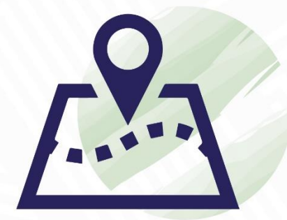
ПРЕДОСТАВЛЕНИЕ МУНИЦИПАЛЬНЫХ ЗЕМЕЛЬНЫХ УЧАСТКОВ БЕЗ ТОРГОВ

ПОЗВОЛЯЕТ СОКРАТИТЬ РАСХОДЫ ПРИ РЕАЛИЗАЦИИ ПРОЕКТОВ, А ТАКЖЕ СНИЗИТЬ СЕБЕСТОИМОСТЬ ПРОДУКЦИИ ПРИ ПРОИЗВОДСТВЕННОЙ ДЕЯТЕЛЬНОСТИ